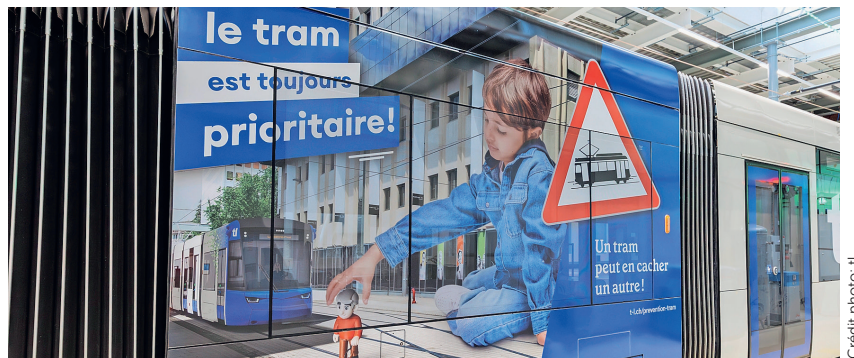
Présentée au public en mars, la première rame du tram lausannois annonce une nouvelle cohabitation sur les routes.

Les vélos et les piétons ne sont pas en reste. Leur implication s'accroît, notamment en raison de l'inattention liée au smartphone et aux écouteurs, et de la présence accrue de cyclistes,